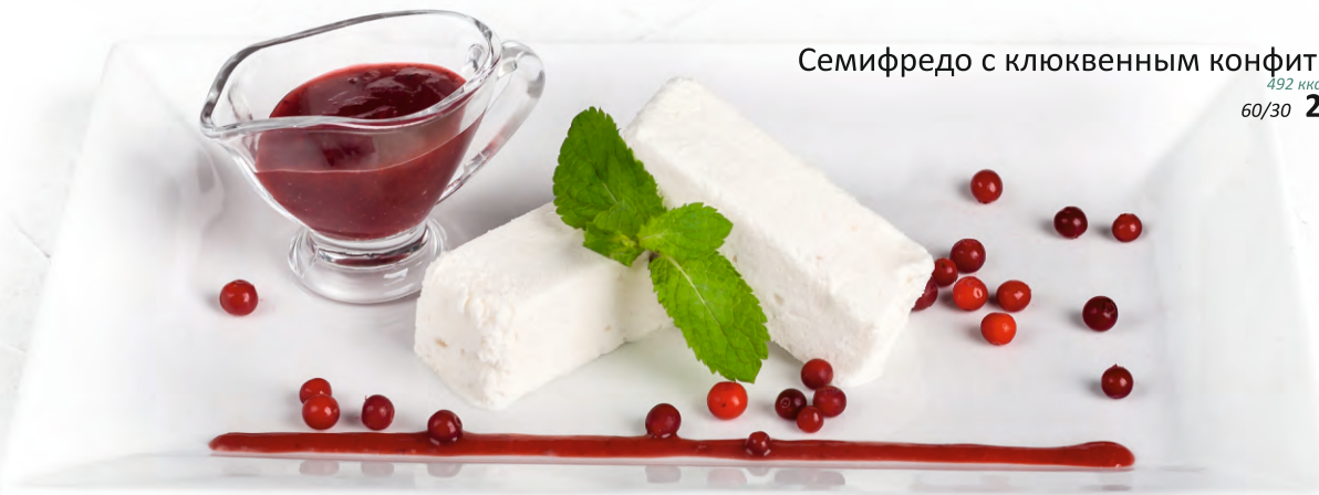
Семифредо с клюквенным конфитуром